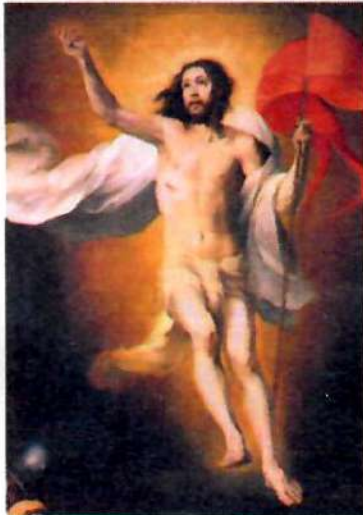
"Risurrezione del Signore", Bartolomé Esteban Murillo. L'alleluia è il canto pasquale per eccellenza ed esprime la gioia incontenibile della Chiesa per la risurrezione.

Nella Bibbia e nei testi liturgici troviamo altre espressioni di esultanza e di invito alla lode ( Grande è il Signore e degno d'ogni lode... Benedite il Signore... ecc. ), ma nessuna di queste condensa in un'unica parola l'espressività dell'alleluia. Anche per questo, la liturgia cristiana ha conservato l'uso del termine ebraico, senza ricorrere a traduzioni che avrebbero sminuito la forza dell'acclamazione, così come per l' amen e l' osanna . Un piccolo termine, dunque, ma dal grande significato teologico. M° Sergio Militello