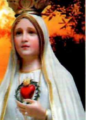
HERALDOS DEL EVANGELIO

San Massimiliano Maria Kolbe scriveva: «La fantasia tende a immaginare Dio Padre, Gesù, l'Immacolata e così via, quali oggetti distinti di altrettante devozioni [...] invece di rappresentarli quali anelli di un'unica catena, subordinati tra loro come vari mezzi a un solo fine: Dio uno nella santissima Trinità. Quanto più uno appartiene all'Immacolata, con tanta maggior franchezza e libertà può avvicinarsi alle piaghe del Salvatore, all'Eucaristia, al sacratissimo Cuore di Gesù, a Dio Padre» (Lett. 603 - Alla Comunità di Niepokalanów ). Egli poneva la consacrazione all'Immacolata a fondamento dell'ordine religioso da lui istituito e ne metteva in luce l'aspetto missionario, sul modello di Maria che visita Elisabetta con Gesù in grembo.